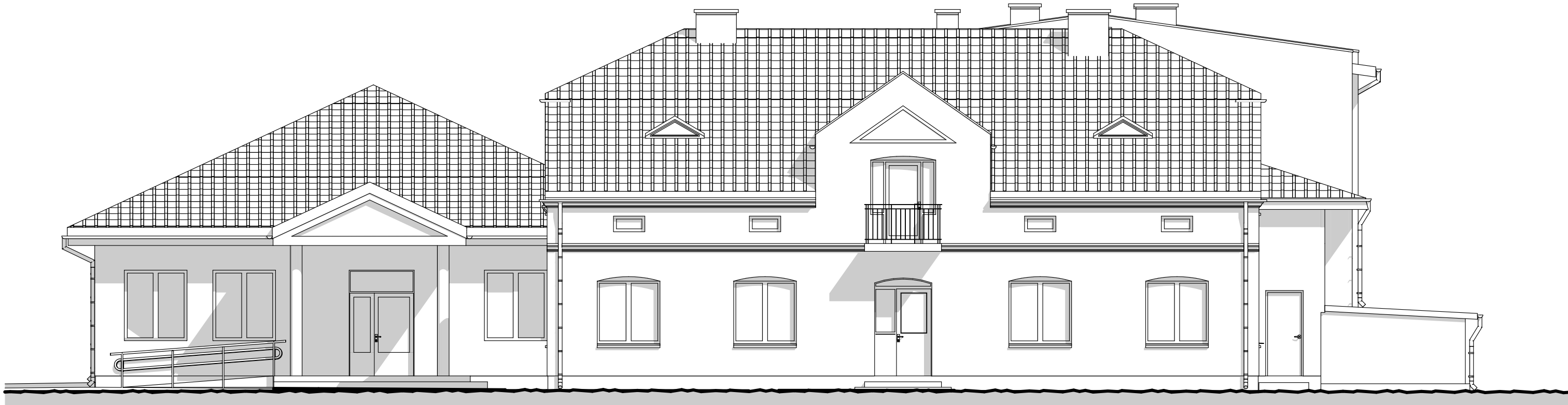
ELEWACJA ZACHODNIA - E1